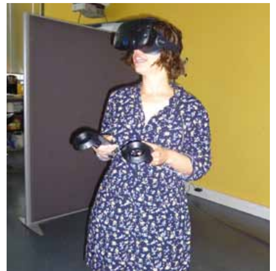
Test d'utilisation d'un casque de réalité virtuelle en prévision de démonstrations sur le stand MSA 49 au Sival, du 17 au 19 janvier 2017 à Angers (49).

(2) stand Grand Palais F/G 474, du 17 au 19 janvier 2017 au parc des expositions d'Angers.